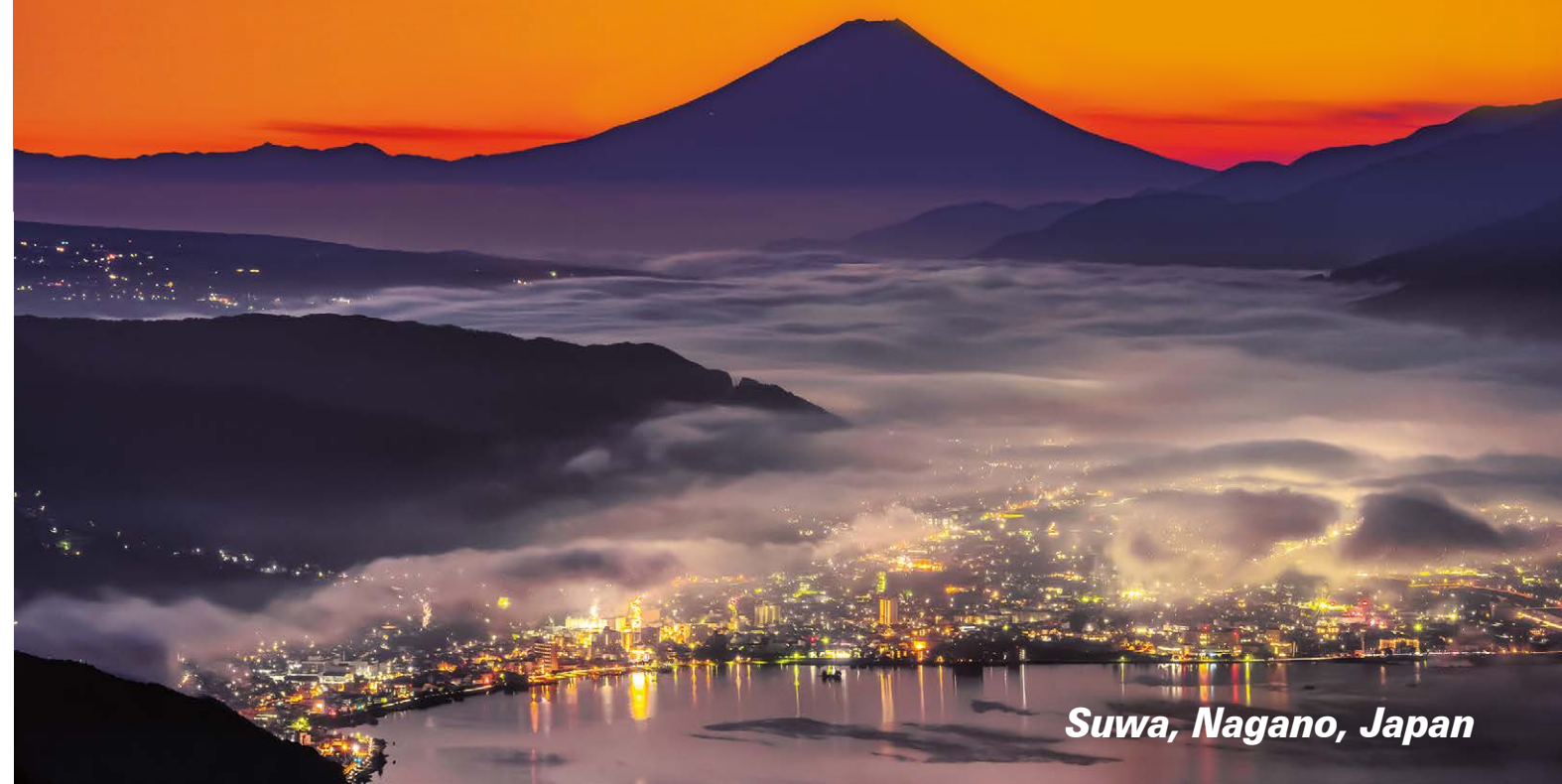
Suwa, Nagano, Japan