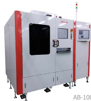
AB-1000 High Accuracy Die Bonder

ด้วยวิสัยทัศน์ที่ชัดเจน จิตวิญญาณแห่งนวัตกรรม และความมุ่งมั่นอย่างแน่วแน่ต่อคุณภาพ บริษัท Athlete FA ยังคงกำหนดเส้นทางแห่งความสำเร็จในภูมิทัศน์แบบไดนามิกของการผลิตในญี่ปุ่น ในขณะที่บริษัทเตรียมพร้อมรับมือกับความท้าทายและโอกาสแห่งอนาคต สิ่งหนึ่งที่ยังคงแน่นอน นั่นคือการอุทิศตนเพื่อความเป็นเลิศจะยังคงขับเคลื่อนการเติบโตและผลกระทบในเวทีระดับโลกต่อไป