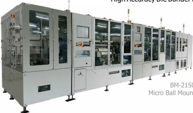
BM-2150SI Micro Ball Mounter

การเน้นย้ำถึงความมุ่งมั่นของบริษัทต่อเทคโนโลยีที่เหนือกว่าและการยึดมั่นในมาตรฐานระดับสูงของญี่ปุ่น คุณ Yamazaki กล่าวว่า: "ผมคิดว่าอาวุธที่ยิ่งใหญ่ที่สุดที่เรามีคือเทคโนโลยีที่เหนือกว่าและมาตรฐานระดับสูงของญี่ปุ่น ด้วยคลังแสงของเทคโนโลยีและคุณภาพ"