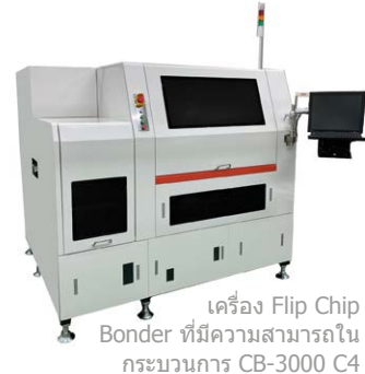
เครื่อง Flip Chip Bonder ที่มีความสามารถในกระบวนการ CB-3000 C4

บริษัท Athlete FA ประสบกับการเติบโตของรายได้ที่โดดเด่นโดยมียอดขายเพิ่มขึ้นในอัตรา 50% ต่อปีตั้งแต่ปี 2563 เมื่อมองไปข้างหน้า คุณ Yamazaki ได้